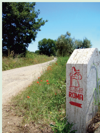
Uno dei cippi segnaletici collocati nel tratto della Francigena che attraversa il territorio di Montefiascone

Il percorso transita nella Valle del Turona accanto al fontanile (1) omonimo e raggiunge dopo 300 mt un largo, presso il quale è edificata una piccola cappella dedicata alla Vergine Maria (2); di qui volta a sinistra e, transitando davanti alla cappella, sale brevemente per poi dirigere su sentiero nel bosco, passando accanto al Fosso d'Arlena, al bivio a Y (3) e, mantenendo la destra, al guado (4) del Molino del Bucine. Superato il piccolo fabbricato dell'antico molino la strada sale sino all'incrocio a T (5), nei pressi di Casa Maccaroni. L'itinerario ora piega a sinistra e, calcando un tratto di basolato dell'antica Cassia Consolare romana, superando (6) Colle della Guardata, arriva alla Quercia del Pellegrino (7). Di qui, piegando a destra, scende velocemente su asfaltata, sino ad incrociare (8), al Km 105, la Strada Statale Cassia; ora piega a sinistra e, dopo 600 mt, al bivio a Y (9) lascia la statale e volta a sinistra. Sale quindi a destra per oltre 3300 mt sino all'incrocio a T (10); di qui, superati circa 400 mt, giunge ad incrociare (11) la Strada Statale Cassia al Km 99,800 circa.